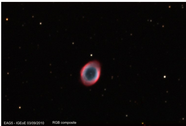
Nebulosa M57 (objecto 57 de Messier) que está a 2300 ano-luz na constelação de Lira

Esta Escola é dirigida a alunos universitários de Física, de Matemática e de Engenharia, com prioridade para os alunos interessados em desenvolver investigação nas áreas de Astronomia, Astrofísica e Gravitação.