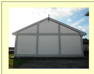
Estação de Braga no Regimento de Cavalaria n.º 6.

Contatos SERVIR: servir@igeoe.pt 218505381 – Direto 218505300 - Central